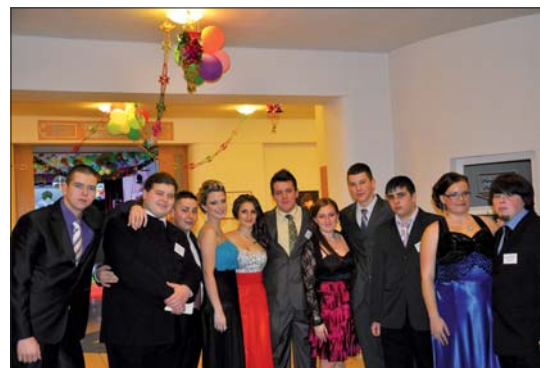
A szervezők és az ifjúsági vezetők