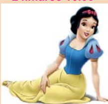
Snehulienka ZO Matice slovenskej