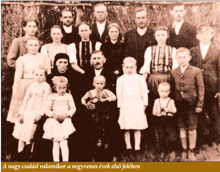
A nagy család valamikor a negyvenes évek első felében