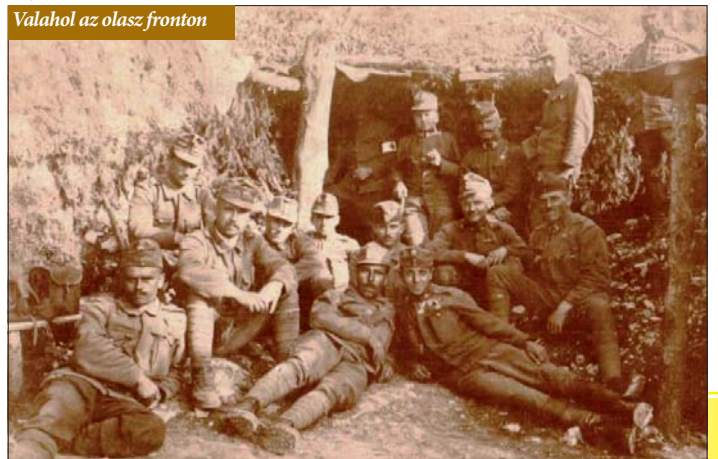
Valahol az olasz fronton